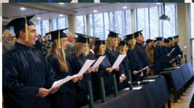
Promocija studenata Agronomskog fakulteta Sveučilišta u Zagrebu