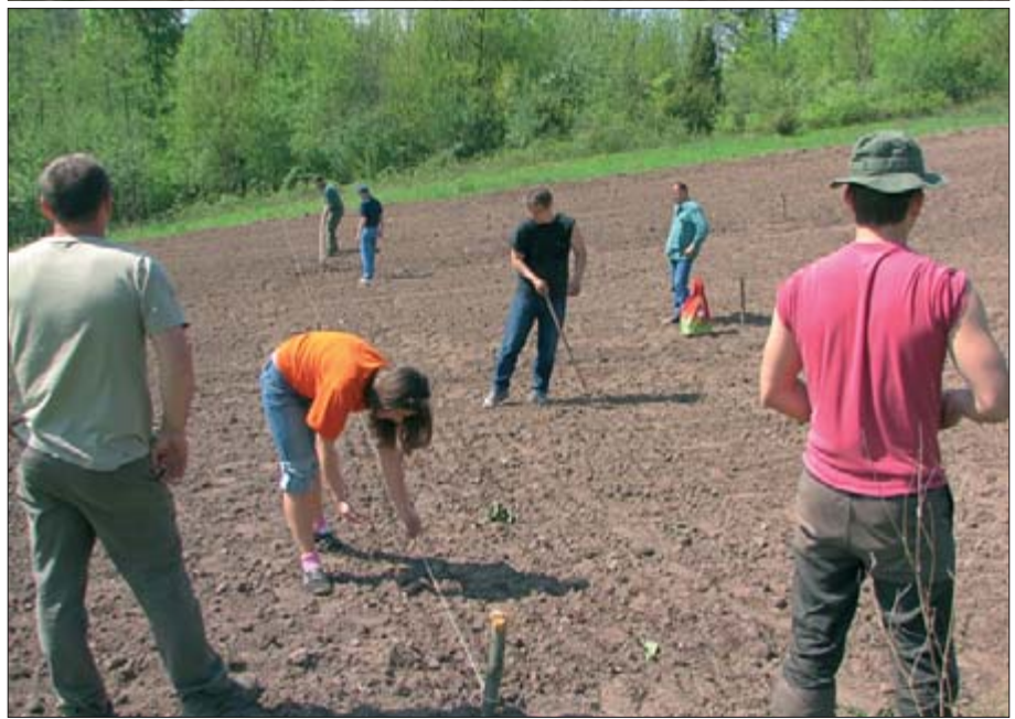
Studenti u posjeti Pokušalištu "Josip ban Jelačić" – Državnom lovištu Republike Hrvatske (III/29) - "Prolom" - Buzeti AFZ